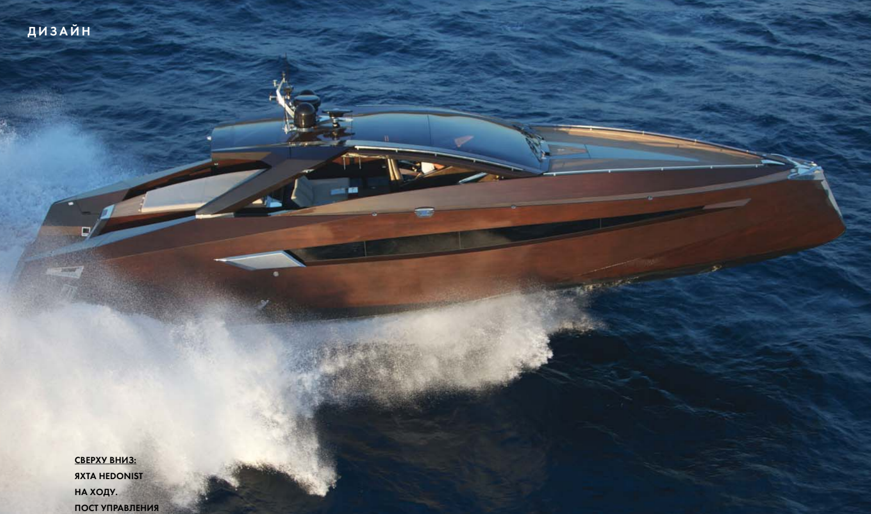
СВЕРХУ ВНИЗ: ЯХТА HEDONIST НА ХОДУ. ПОСТ УПРАВЛЕНИЯ